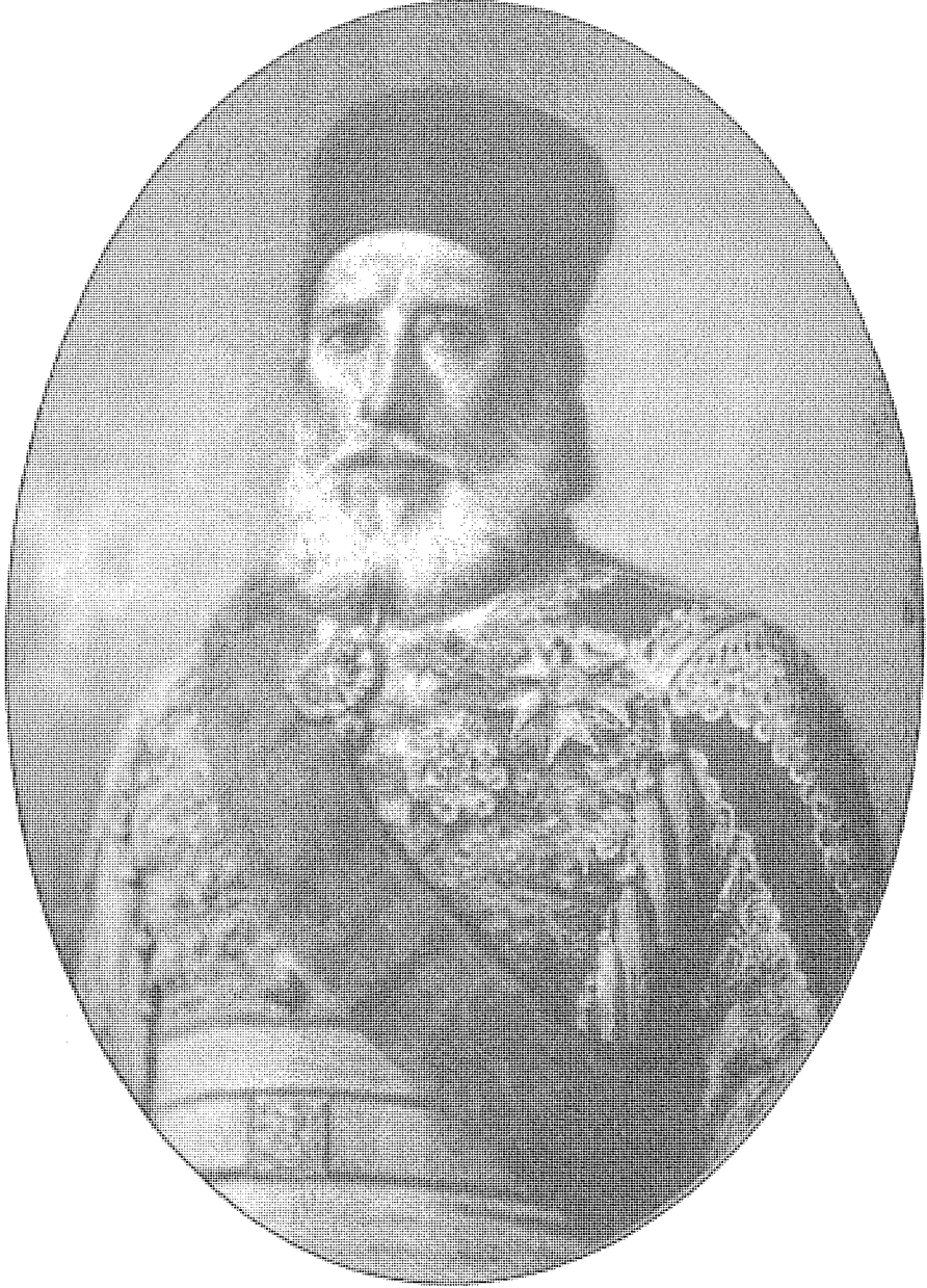
إبراهيم باشا تولى حكم مصر بضعة أسابيع ومات في حياة محمد علي